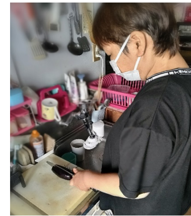
道具や工程の工夫で料理も可能に

難しくなっている工程を見直し、工夫したり、練習したりする事でできる事が沢山あります。ぜひ、チャレンジしたい時はOTまでお声掛けください。