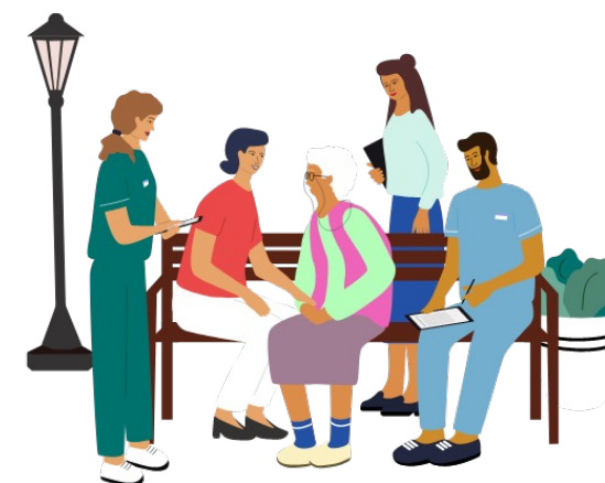
ケアマネジャーはチームの要