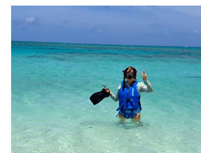
ついに沖縄にもキャンナスが