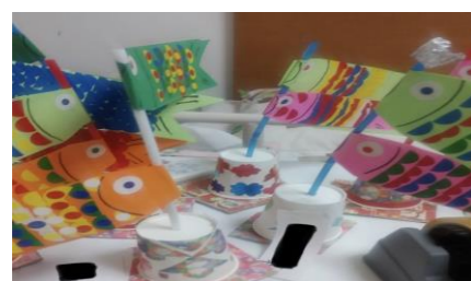
季節のイベントを大切に。 ご家族にも寄り添ったケアを心掛けています。 地域密着方サービスで藤沢市在住の方が利用できます