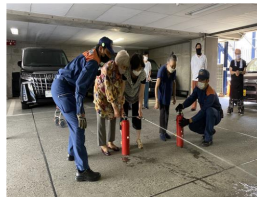
駐車場で消防訓練 消防士の方より指導受けました。