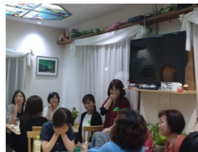
12日の夕食会は遅くまで盛り上がりしました(笑)