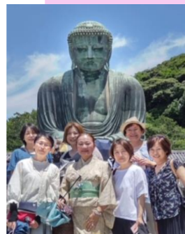
天候にも恵まれ、参加者は初夏の鎌倉も堪能しました。

13日(月)、鎌倉大仏・長谷寺を散策してお昼に華正楼でのランチでした。まだまだ話が尽きませんが解散となりました。これからも皆様と共に進んでいきましょう。