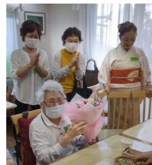
大ベテランの早出代表、これから発会の方も含め31人が参加。時間を忘れて語り合いました