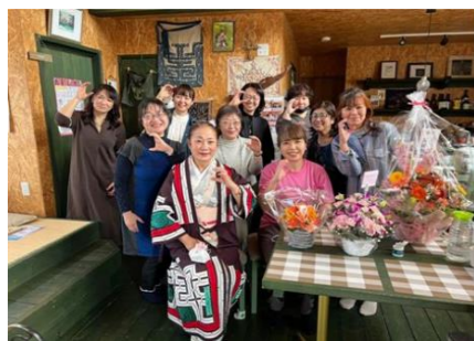
キャンナス苫小牧・白老